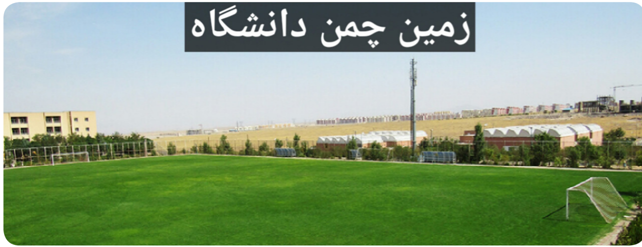
زمین چمن دانشگاه