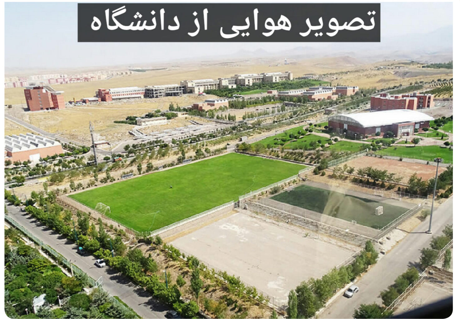
تصویر هوایی از دانشگاه